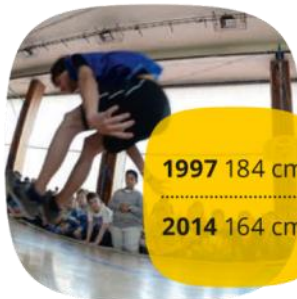
Chlapci 13 let skok do dálky