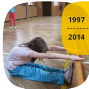
Dívky 9 let hluboký předklon